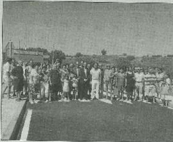
Iglesias con los vecinos en la travesía de la carretera urbanizada.

ambas localidades, señaló que la Diputación de Salamanca ha hecho lo que es su deber: "estar cerca de los municipios más pequeños, especialmente, y ayudarles en la medida de lo posible, más en estos tiempos difíciles donde hay que ser escrupulosos con la gestión de los dineros públicos. Agallas y Vegas tenían una necesidad para mejorar la calidad de vida de sus vecinos y creo que con estas obras lo hemos conseguido".