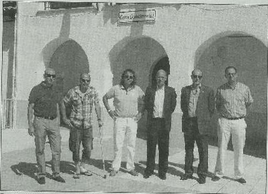
El presidente de la Diputación y varios diputados provinciales con los responsables municipales de Agallas.

Javier Iglesias, ante las muestras de agradecimiento de los vecinos de